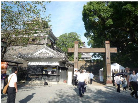
熊本城桜の馬場リテール(株)は、熊本城観光客等に対

現在5期目で、このうち1期だけ黒字、今期は60万円の赤字、130万円の累積赤字となっていますが、さらに20~30の事業を実施するべく第2次基本計画策定のための事業の洗い出し作業を行っており、中心市街地のタウンマネジメント機関として、ともかくやる気と本気をもって臨まなければならないと意気込み強くおっしゃっていました。