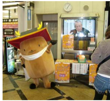
バル当日 まんとくんがまちなかバルのPRをしてくれました おつかれさまです

なお、インフォメーションにおいて設置しました台風12号に伴う豪雨による災害義援金箱にお寄せいただいた1万5千6百6円につきましては10月25日に奈良県へ振込み県から被災地に送られます。