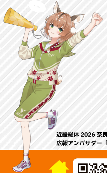
近畿総体 2026 奈良県 広報アンバサダー「奈々鹿」