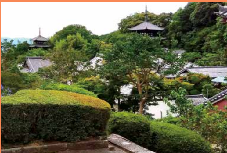
奈良時代の両塔が現存している當麻寺

二上山の麓を歩き、飛鳥・天平・平安時代の歴史に触れます。悲運の皇子・大津皇子の古墳ではないかといわれる鳥谷口古墳。阿弥陀様に導かれ西方浄土に旅立たれた中将姫が織りなした當麻曼荼羅を拝し、中将姫に思いを寄せます。NPO法人「奈良まほろばソムリエの会」の案内で巡ります。