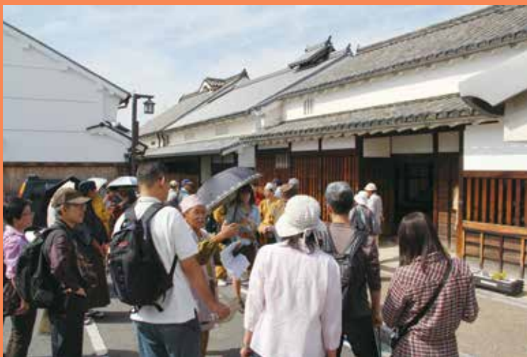
今井町 町並み散歩

全国町並み保存連盟のパイオニアである、重要伝統的建築物群保存地区の橿原市今井町でこの町の保存にかける人たちの歴史への思いや、おもてなしの心を「Nara観光コンシェルジュ」の案内で体験していただきます。