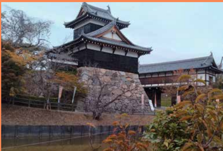
郡山城「郡山城追手門」と追手向櫓

2026年NHK大河ドラマ「豊臣兄弟」で話題の秀長公の造られた城下町大和郡山を歩きます。秀長公ゆかりの社寺や史跡をめぐり歴史を学び、金魚ストリートを歩き、郡山城からの絶景を楽しみます。修復の終わったばかりの秀長公の位牌のある菩提寺、春岳院の仏像を拝観し、最期は大納言塚にお参り。たっぷり金魚と秀長公の町、大和郡山の歴史と魅力を体感しましょう。