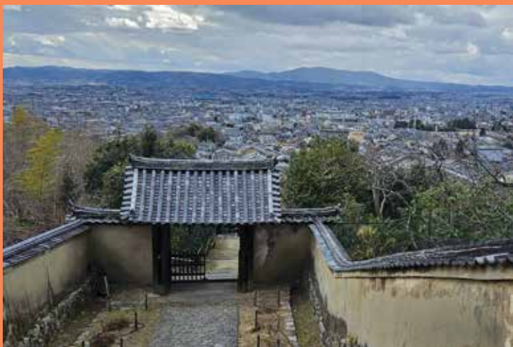
白毫寺山門から奈良盆地を望む

奈良市高畑は、高円山西麓、春日大社の南側にあり、明治時代まで春日大社の神職が住んでいた町でした。志賀直哉をはじめ、大正、昭和の文人たちが集った芸術文化の町としても知られています。またこのエリアでは、十二神将で有名な新薬師寺や境内から奈良の街を一望できる白毫寺など、一度は訪れたい神社仏閣が点在しています。奈良公園や東大寺などの賑わいとは一味違う閑静な高畑界隈で数々の古刹を訪ねます。