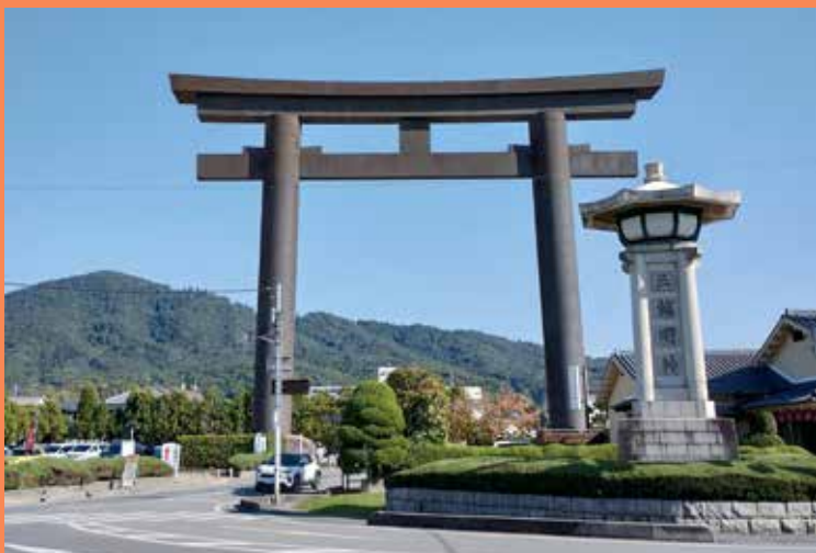
大神神社一の鳥居と三輪山

『記紀』の舞台・桜井は、日本の“はじまり”が幾重にも重なる地です。海柘榴市に見る古代交流のはじまり、仏教伝来という新たな思想と国家形成のはじまり、そして三輪山を神体山として仰ぐ原始信仰のはじまり。市が人を呼び、教えが広まり、祈りが形づくられていった、その源流をたどりながら大神神社へと歩みます。