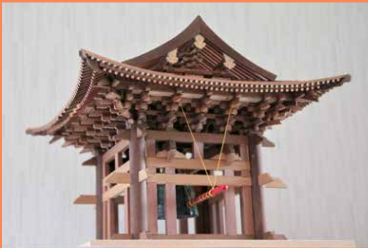
東大寺 鐘樓の模型

奈良公園には奈良時代やその後に再建された東大寺や興福寺の国宝建築物がキラ星のごとく建ち並んでいます。それらの国宝建築物を巡りながらそれぞれの由来や構造の特徴などをご説明し、その美と匠の技を味わっていただきます。